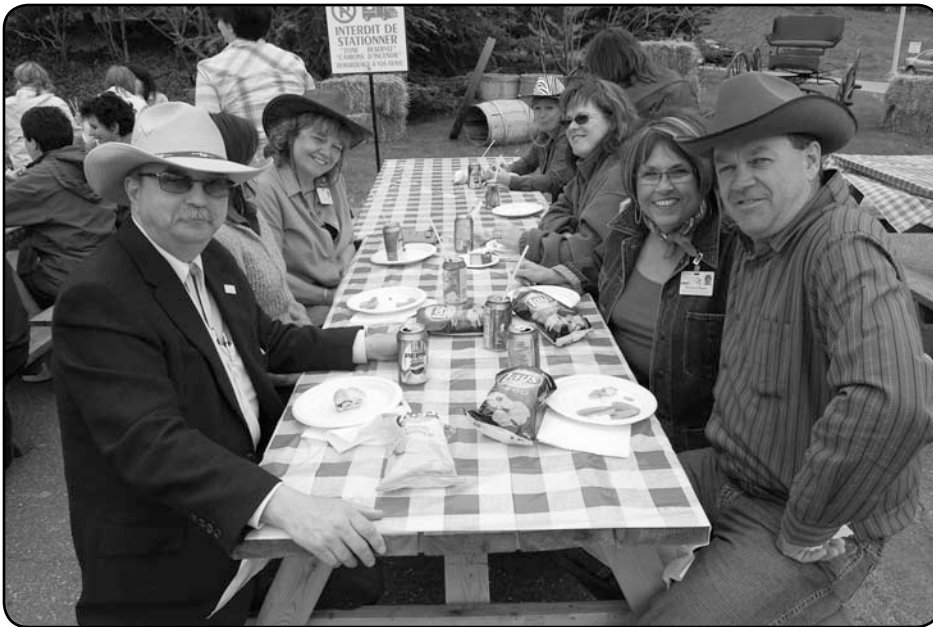
Les cowboys de l'administration, à Edmundston...