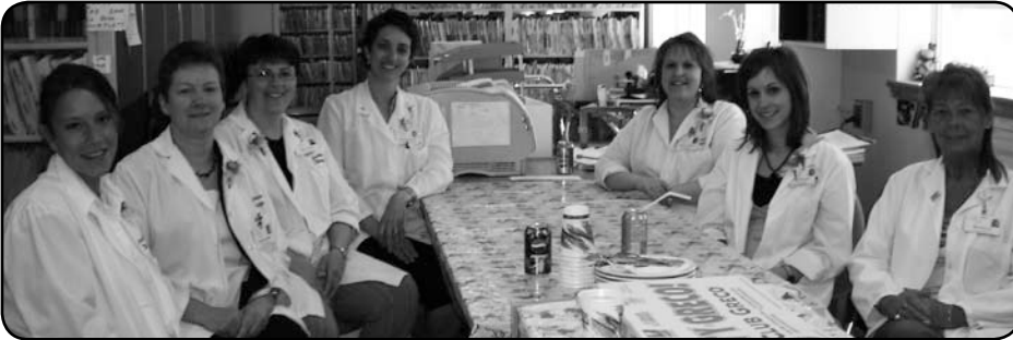
Les archivistes de Grand-Sault ont pris quelques minutes pour se payer une bonne pizza.