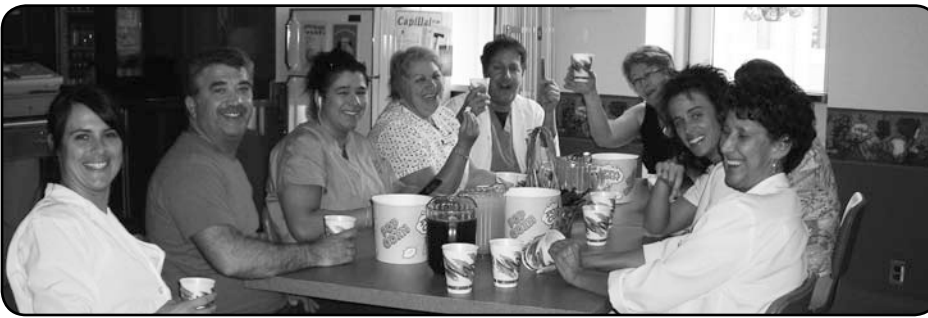
Le jeu popcorn, à Saint-Quentin, a bien fait rigoler les participants.