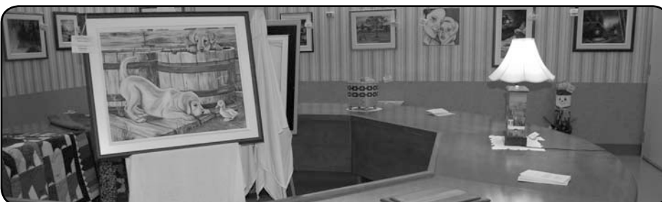
La Galerie des artistes, à Edmundston, a surpris plusieurs par la qualité des œuvres exposées.