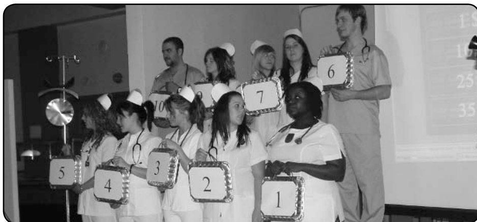
Les beautés de l'activité « Le banquier » ont fait fureur!

Le souper s'est déroulé à Edmundston, à Grand-Sault et à Saint-Quentin le 14 mai. Il fut un franc succès dû à la grande participation aux activités de reconnaissance et de divertissement. Soulignons à Edmundston que trois participant(e)s ont joué au jeu « Le banquier », une activité qui fut très appréciée.