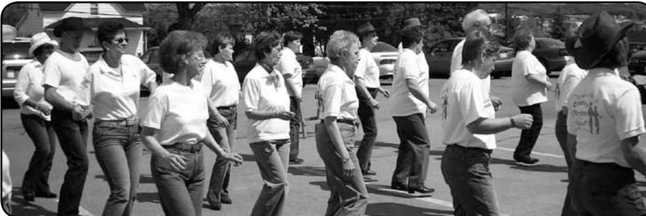
On s'est « swigné » la patte au diner western de Grand-Sault!