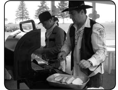
Un copieux repas au diner western de Saint-Quentin.